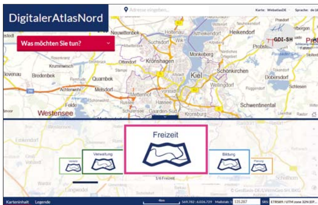
Abbildung 1: Hauptportal DANord

Zugriff: http://portal.digitaleratlasnord.de