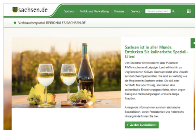
Screenshot der Einstiegsseite des Verbraucherportals Regionales.Sachsen.de

Nach dem Portal ELBA.Sax ist das Portal Regionales.Sachsen.de ein weiteres Beispiel für die Einbindung der GeoBAK in digitale Prozesse einer modernen und zeitgemäßen Verwaltung.