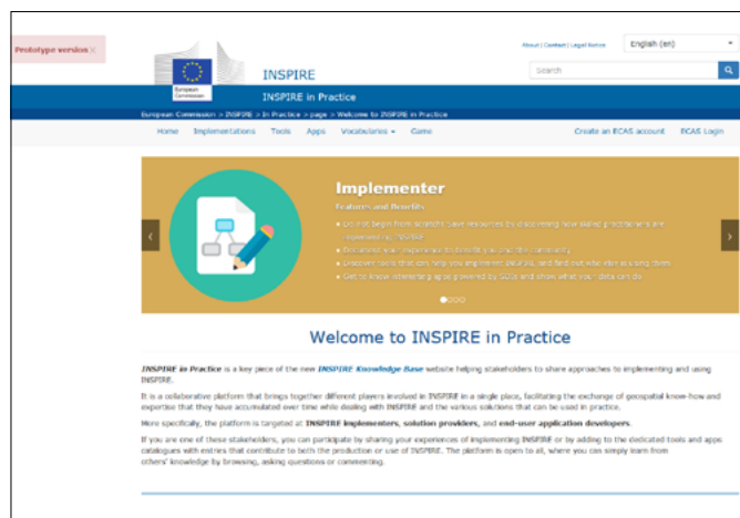
Screenshot von der Einstiegsseite „INSPIRE in Practice“

Im Bereich „Vocabularies“ werden vordefinierte Begriffe und Wörter - Vocabularies - im Sinne einer einheitlichen Terminologie geregelt. Ziel ist es, Inhalte der Plattform systemübergreifend referenzierbar zu machen und Querverweise zu ermöglichen und somit potentielle Probleme durch Polysemie oder die Verwendung von ungenauer Terminologie zu minimieren. Darüber hinaus gibt es z.B. auch eine Glossar-Seite, welche einen Überblick über gemeinsame Begriffe, die auf der Plattform verwendet werden, gibt.