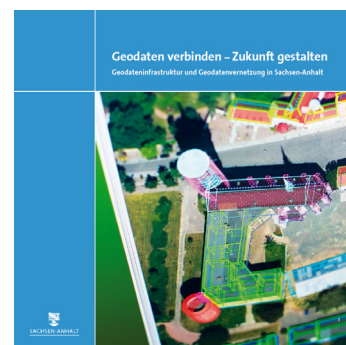
Broschüre "Geodaten verbinden - Zukunft gestalten.