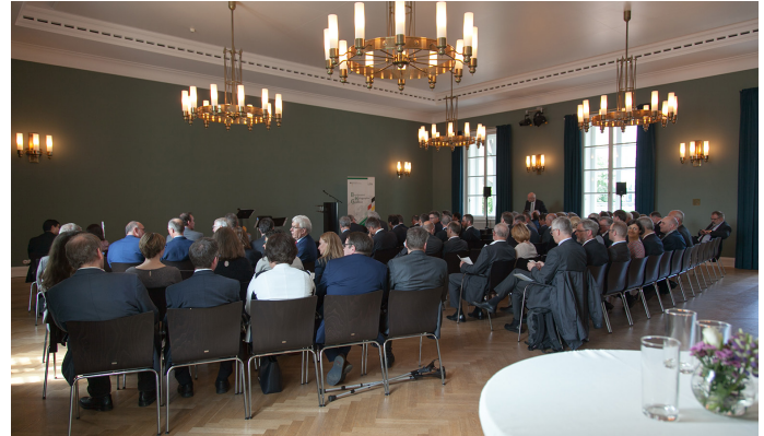
Hochrangige Gäste im Lesesaal des Literaturhaus Frankfurt

Beim anschließenden Empfang ergab sich für viele Gäste noch die Möglichkeit, Becker im persönlichen Gespräch alles Gute für seine Vorhaben im BKG zu wünschen.